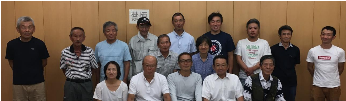
そのべ farmers 設立会の集合写真

先ずは、10 月 13 日(日)「園部くんち」、11 月 9 日(土)「筑紫ガスまつり」、11 月 30 日(土)「J R九州ウォーキング」において、農産物の P R がおこなわれる予定です。