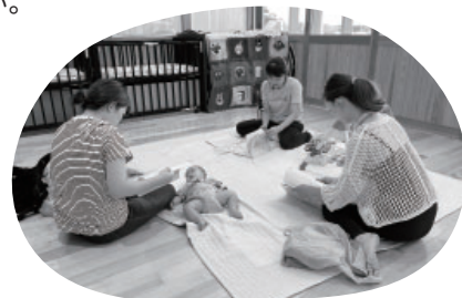
▲離乳食教室の様子。月齢の近い赤ちゃん と保護者同士の交流にもなります。