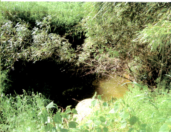
③先の排水が悪く水が溜まっている