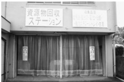
旧社会福祉協議会敷地内