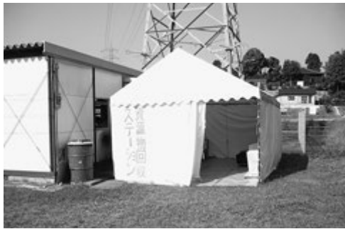
基山町役場西側テント内

しかし、資源化量は年々減少傾向にあり、特に有価物として売却できるお菓子箱等の雑紙を含む古紙は「可燃ごみ」として多く出されています。