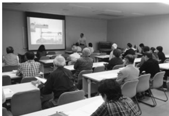
文化遺産ガイド勉強会の様子