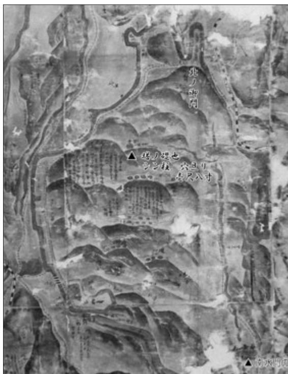
椽之城 太宰府舊蹟全図 南