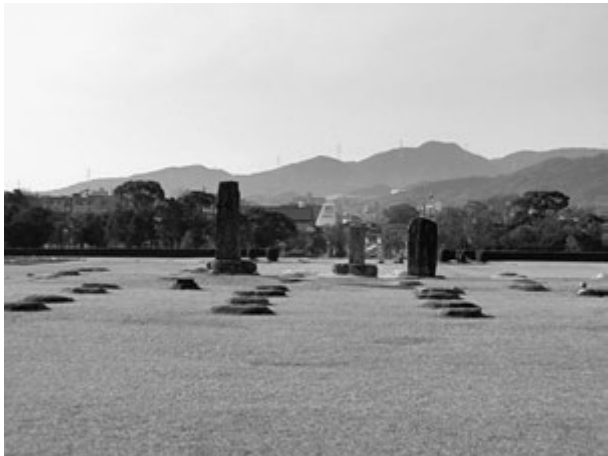
大宰府政庁跡(都府跡)から南に基肄城が見える(最も高く平らになっている部分が基山山頂)