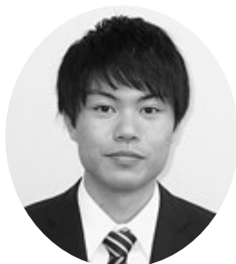
則本 恭 こども課 子育て支援係